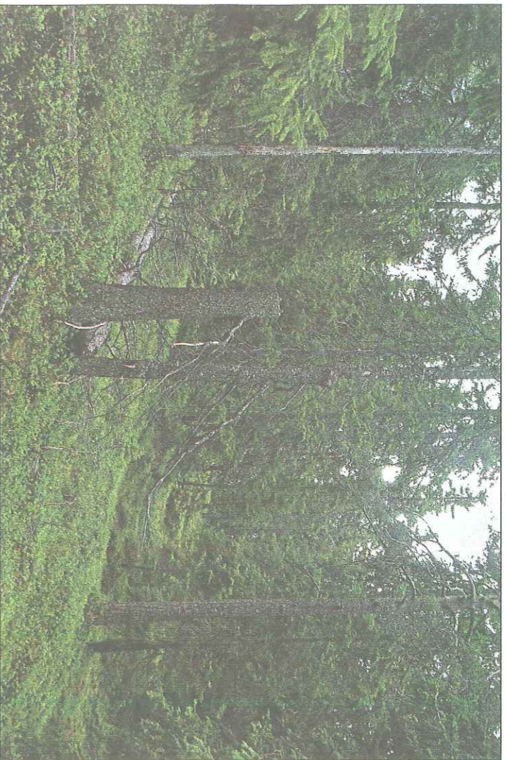
Er skogen ved Østjævvallsbrenna «eventyrskog» eller «gammel skog med dårlig sunnhet»?