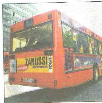
Utbygging av kollektivtransport