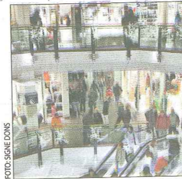
Gjør ikke nok for å begrense utbygging av kjøpesentre.

Her er vi minst fornøyd med kommunenes innsats: