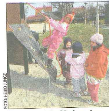
Gjør ikke nok for å ha barnehager som kan nås uten bil.