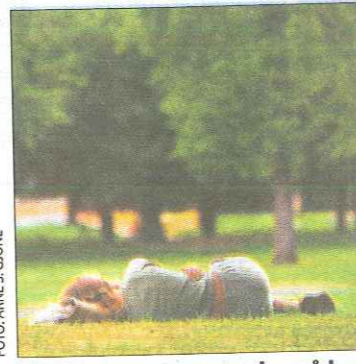
Flere grønne leke- og parkområder