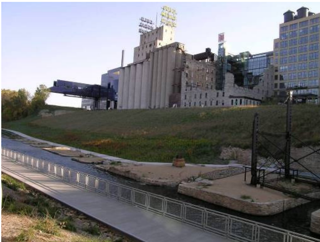
Transformasjon av elvefront