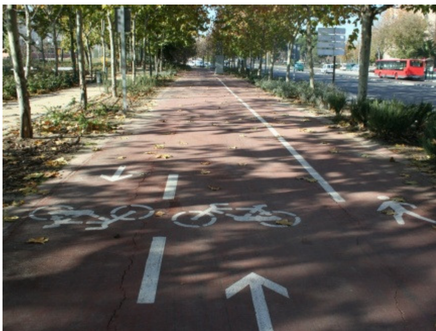
Gang og sykkelvei