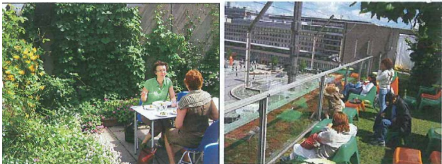
Takhage eksempler !