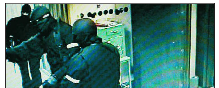
Tellesentralen NOKAS ble ranet 5. april i fjor.