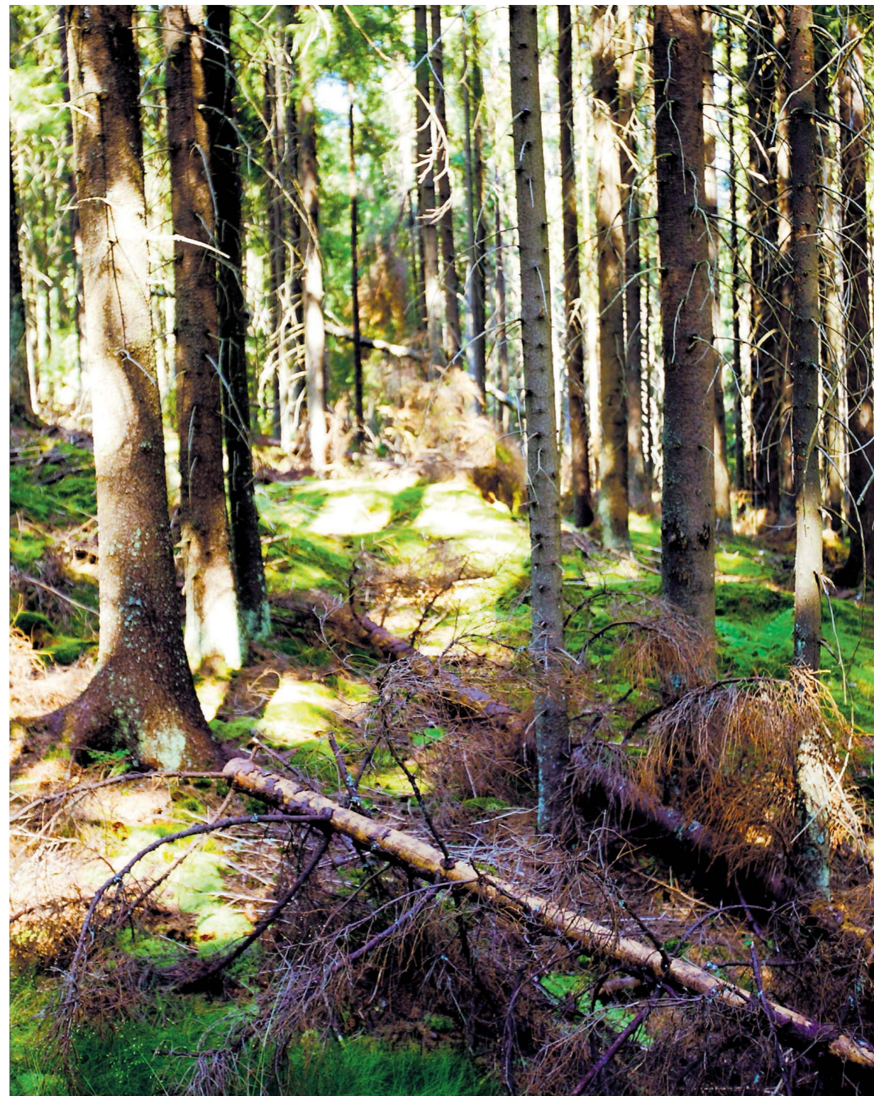
Turgåere vil se skogen, men ikke bare trær, slik som her. Uten utsikt blir ikke opplevelsen den samme, er oppfatningen.

– Dagens skoger er annerledes enn de vi hadde for en del tiår tilbake, bekrefter Frivold. Både innføringen av flatehogst, bygging av utall skogsbilveier og etter hvert også ulike lover og regler som har lagt føringer for bruken av skogen, har i stor grad vært med på å påvirke dens utseende de siste 80 årene, påpeker han.