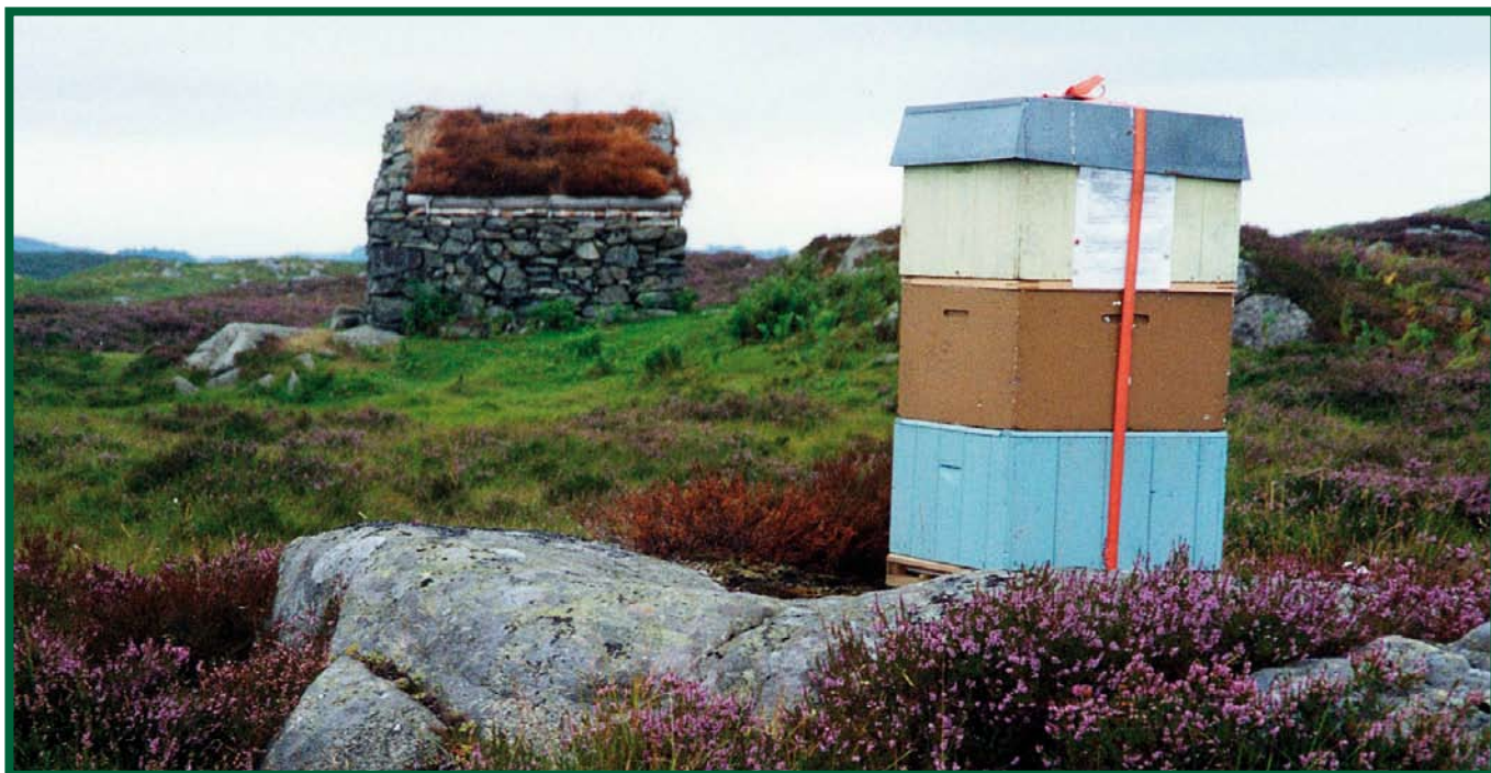
Bikube ved Lyngheisenteret.