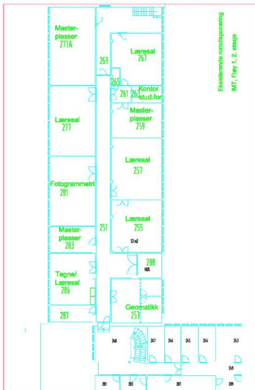
Figur 1 – Tidligere planskisse