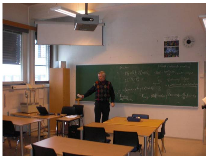
Figur 2 – korridor og en av læresalene