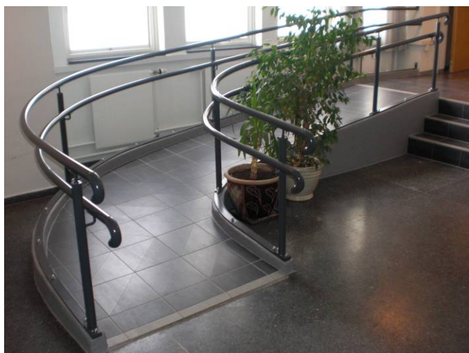
Figur 4 – bilder fra ny læresal, korridor og ny rampe